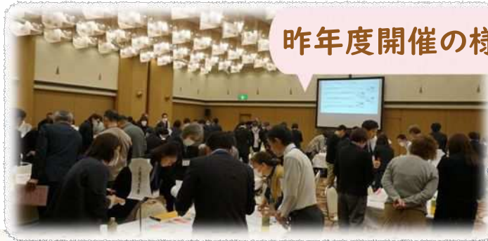
昨年度開催の様子